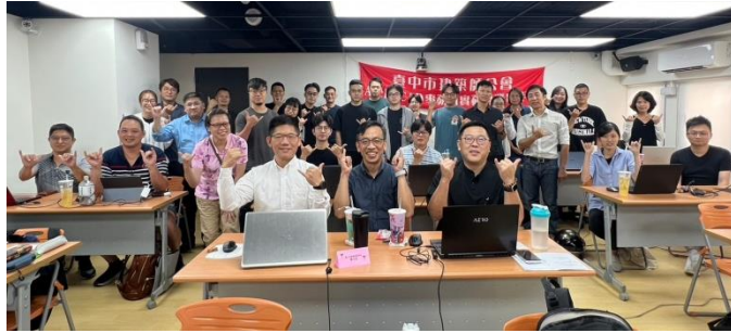
圖/2023 年度魯班學堂結業合影

本課程由專業建築師傳授 ARCHICAD 導入及實務應用，教您完成「建照圖」及「都審報告書」